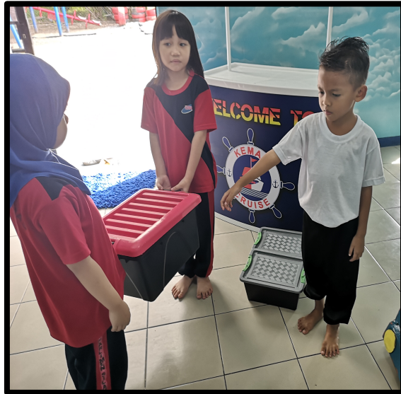
Adik Jayna dan Adik Syafa memungghah dan menyusun barang di kawasan pelabuhan