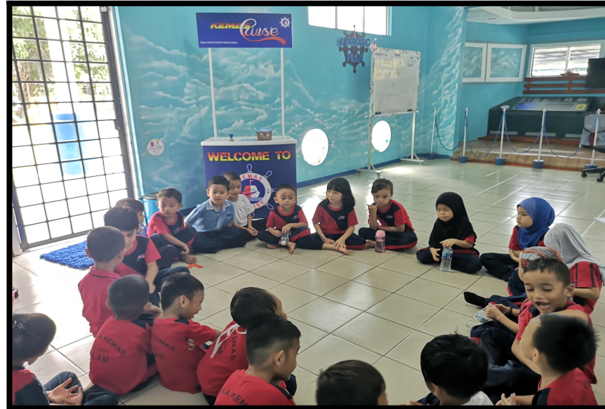
Kanak-kanak meluahkan perasaan dan pengalaman semasa melakukan watak